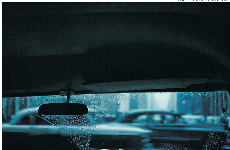
SAUL LEITNER / GALERIA ALTA