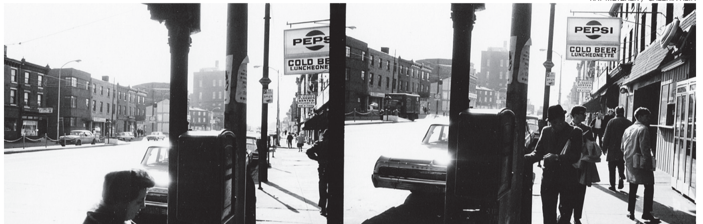
RAY METZKER / GALERIA ALTA